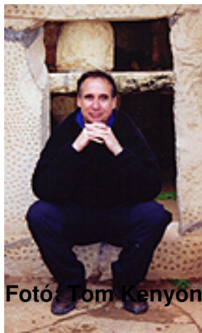
Fotó: Tom Kenyon